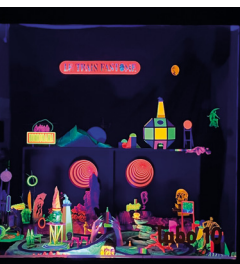
© Macula Nigra &amp; Simon Poligné

Le Volume / De 3,5 à 12€ / Réservation conseillée Tout public à partir de 5 ans / 45 min