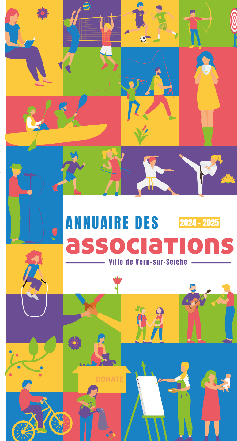
Réalisation : A.Rouat / Ville de Vern-sur-Seiche / Vecteezy.com / Freepik.com